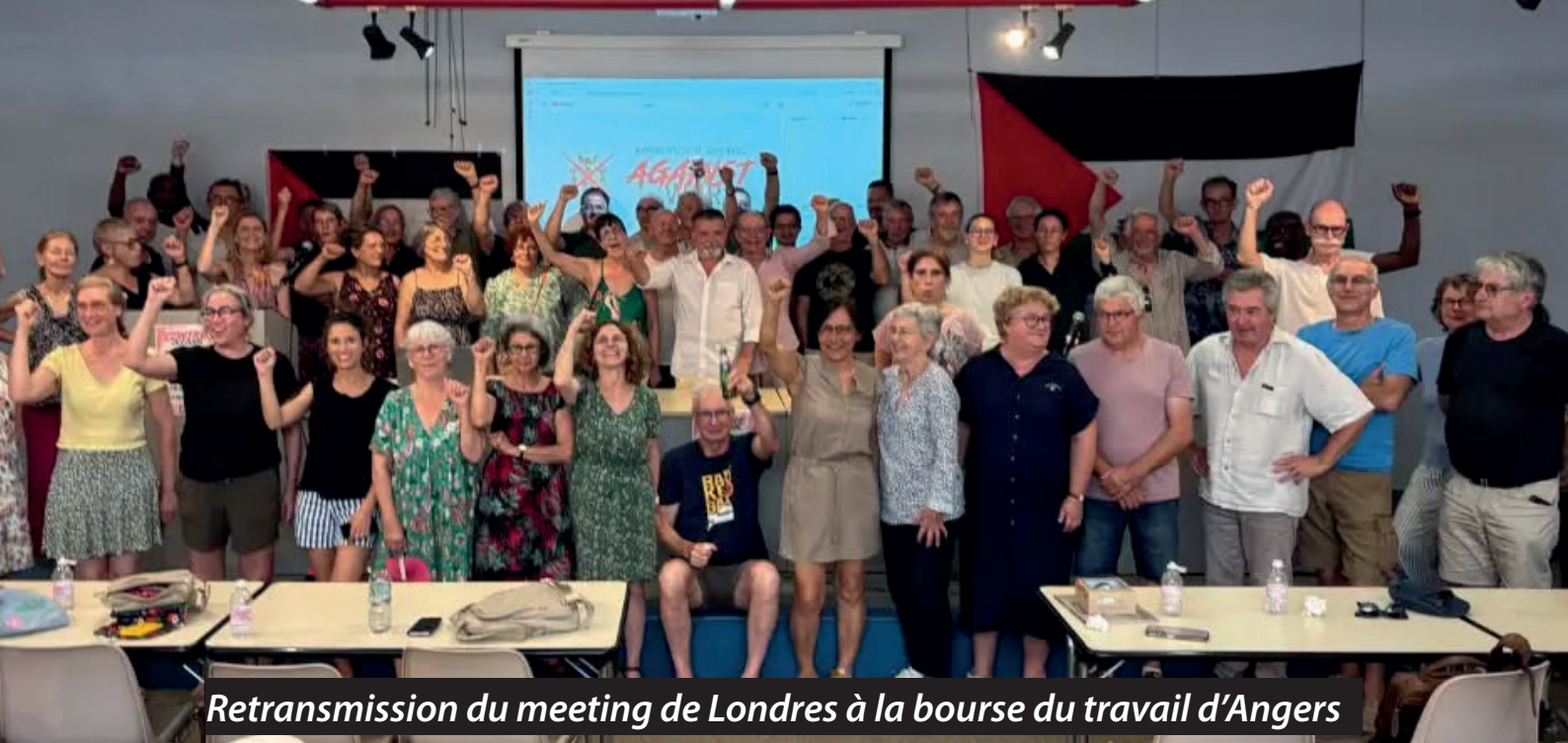
Retransmission du meeting de Londres à la bourse du travail d'Angers