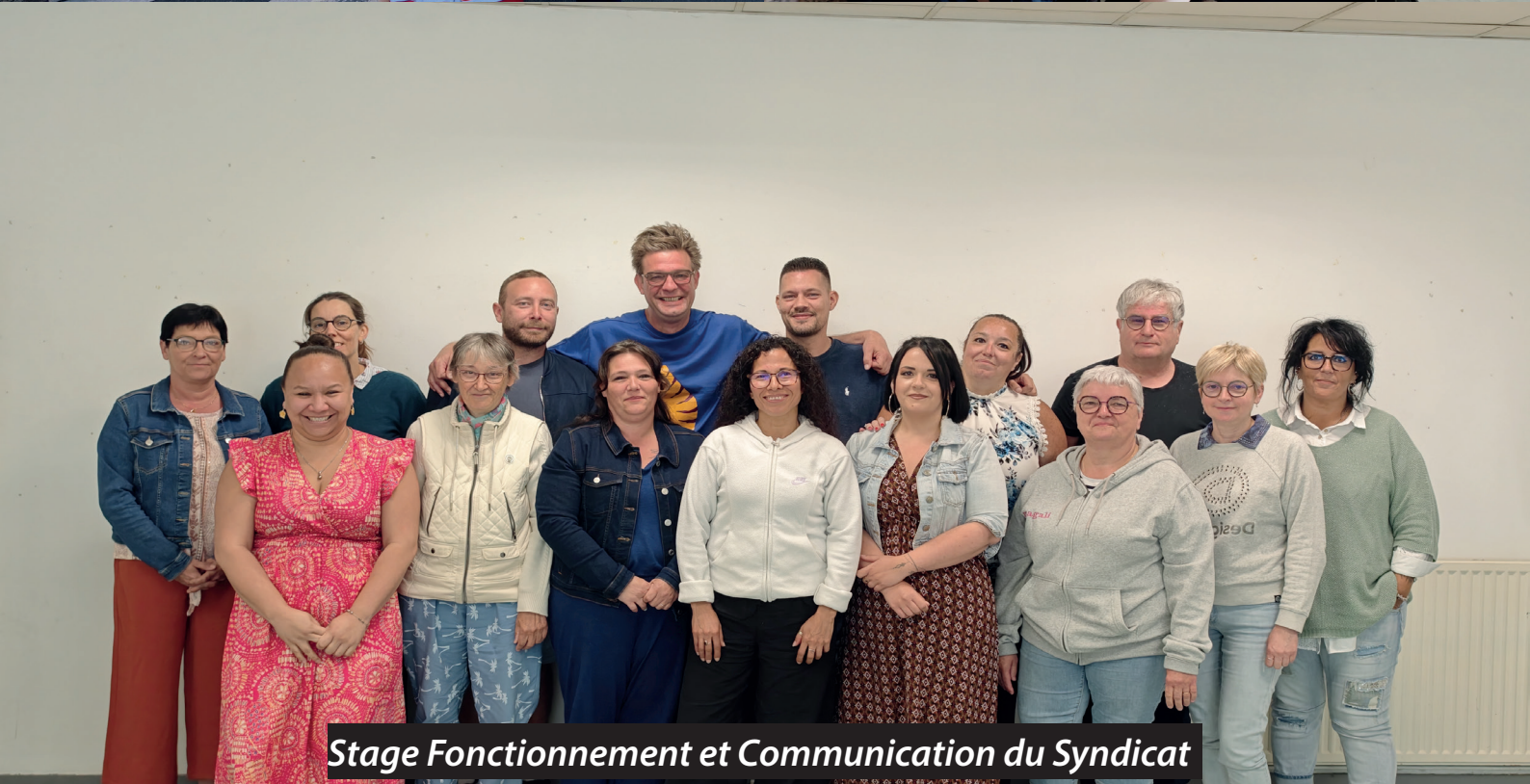
Stage Fonctionnement et Communication du Syndicat