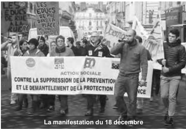
La manifestation du 18 décembre

18 Décembre à Angers : 500 travailleurs sociaux soutenant les salariés du service de prévention spécialisée de l'ASEA (Association pour la Sauvegarde de l'Enfance et de l'Adolescence) manifestent à l'appel de l'intersyndicale FO - CGT - CFTD - SUD