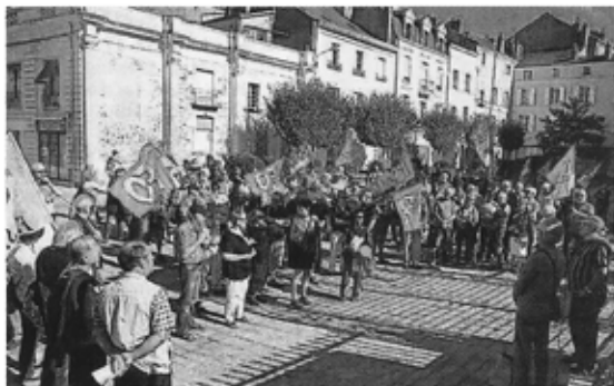
Angers, hier. Une prise de parole a eu lieu avant la remise d'une motion.

complémentaires ont augmenté de plus de 13 % depuis 2001. En outre, les perspectives ne sont guère réjouissantes. Pas seulement à court terme, avec le nouveau gel des pensions annoncé hier par le gouvernement pour l'année qui vient, mais aussi à plus longue échéance, avec la menace qui place sur la survie de la pension de réversion et sur la baisse des pensions de retraite complémentaire dès la génération 1959. Ils réclament une revalorisation mensuelle et immédiate de 300 €, et demandent une indexation non pas sur les prix, mais sur le salaire moyen.