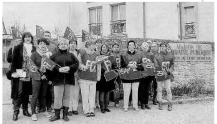
Montreuil-Bellay, maison de retraite, hier. Les agents n'en peuvent plus et sont mobilisés pour le faire savoir.

Comment en est-on arrivé à une telle situation ?