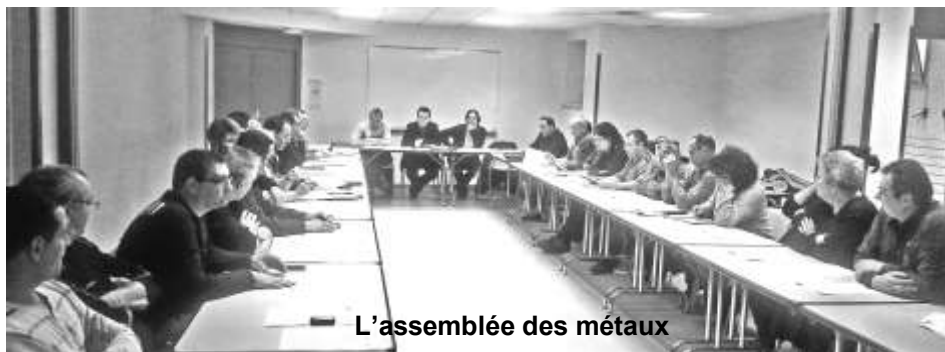
L'assemblée des métaux

Le 6 Février dernier se sont tenus le congrès annuel de l'Union des Syndicats des Métaux du 49 ainsi que l'assemblée générale annuelle du syndicat des métaux d'Angers et Environs.