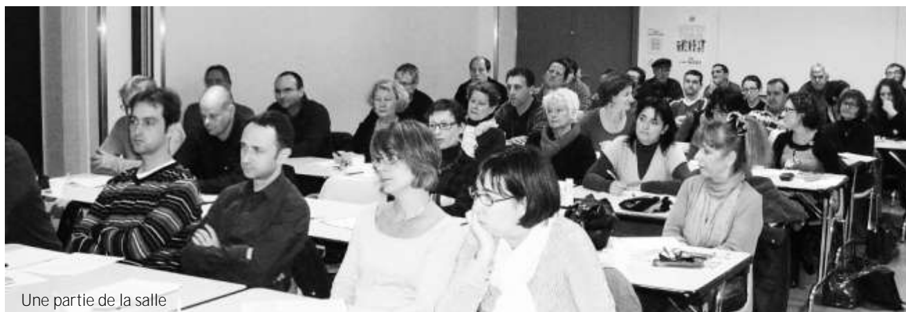
Une partie de la salle

De l'avis de tous, la discussion a été particulièrement intéressante et a permis de bien préparer l'activité du syndicat pour l'année qui vient.