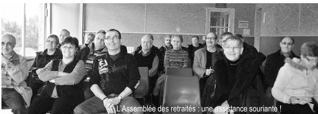
L'Assemblée des retraités : une assistance souriante !