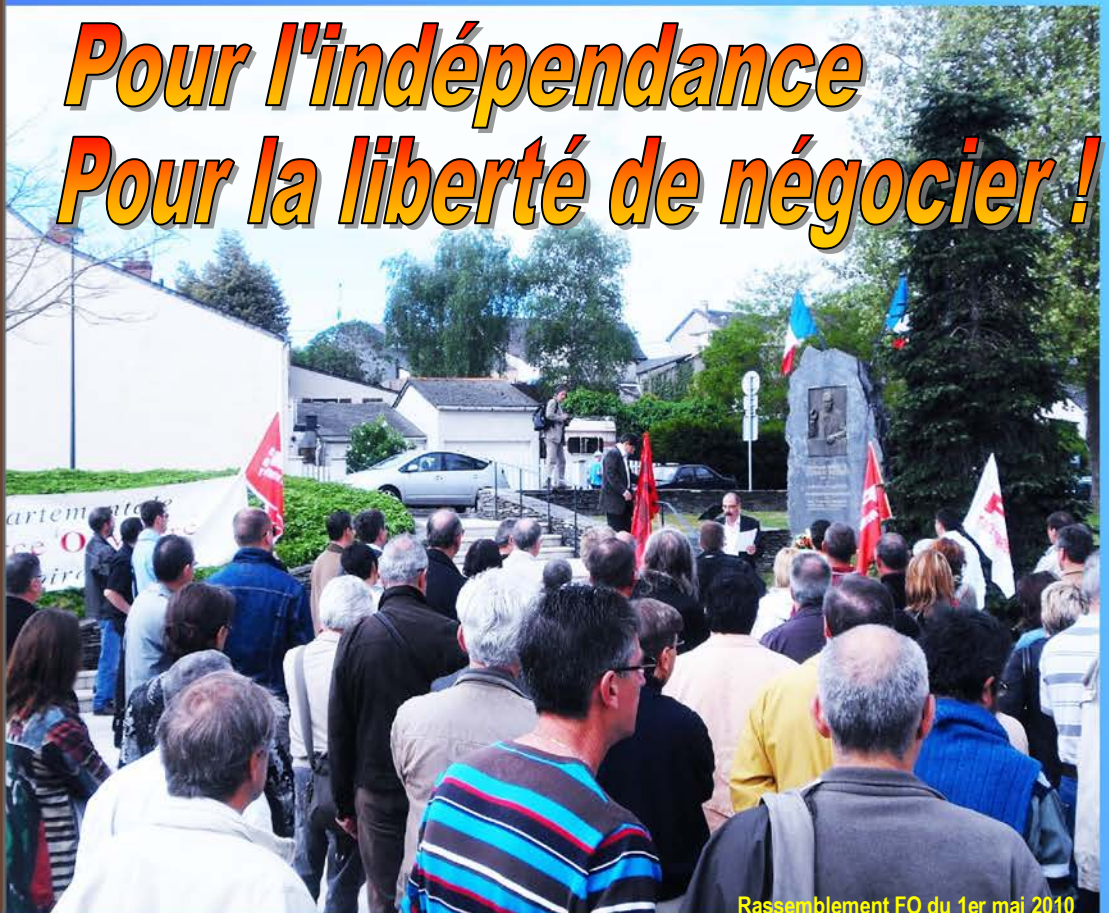
Rassemblement FO du 1er mai 2010

Pour l'indépendance Pour la liberté de négocier !